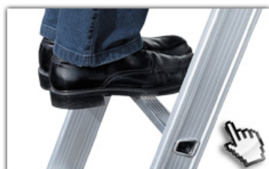
32mm tiefe, gewinkelte Trapezsprossen